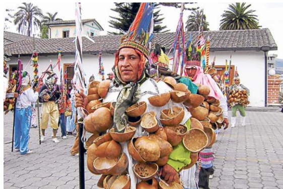
Figura 9. Yumbo Mate.

El personaje de Yumbo Mate se caracteriza por tener un traje compuesto por mates secos, el cual da ritmo y complementa al mamaco con el sonido del tambor y pingullo. Este no posee una careta o malla que cubra parcialmente el rostro, sino que se muestra como un indio Yumbo.